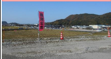
路肩の墜落転落防止対策

掘削土積込箇所横の通路に大きな転石がありました。落石防止対策や立入禁止措置が必要ではないかと感じました。