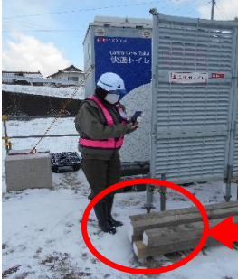
現場トイレ：男女の明示良好

【指摘事項】 現場休憩所周辺に資材や工具が点在していました。特に現場トイレ前は動線になるため、躓きや転倒の原因にもなります。直ぐに使用されない場合は、資材置き場で保管をお願いします。