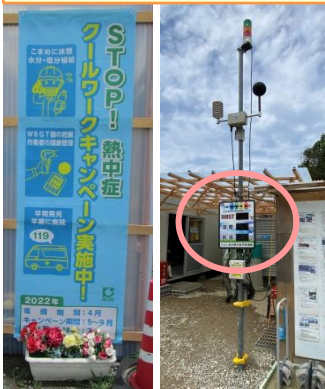
熱中症予防情報で注意喚起、塩タブレットやほし梅も常備

作業員の誰もが目につきやすい位置に、「工事事故事例」や、注意喚起の垂れ幕・電子掲示板が設置されていました。電子掲示板には、「安全は急がす焦らず怠らず」の全国安全週間のスローガンが表示されています！