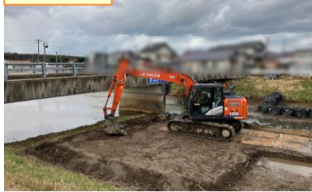
【道路汚損防止対策】敷鉄板の下に土木シートが設置されています。