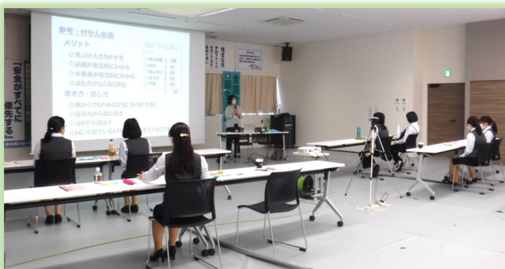
ワークライフバランス研修会